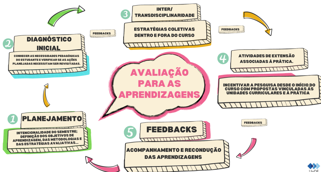
Figura 03: Mapa conceitual da avaliação para as aprendizagens da UnDF

Nesse sentido, o ciclo da avaliação para as aprendizagens compreende as seguintes etapas: