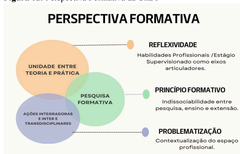
Figura 02: Perspectiva Formativa da UnDF